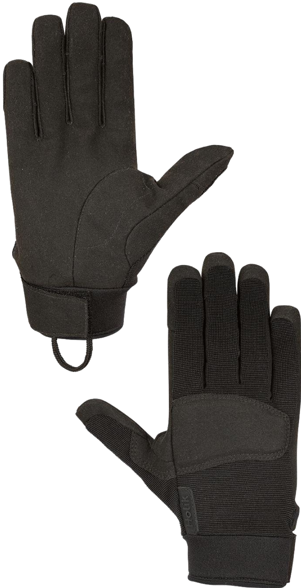
ZETA Short Black

Textilní rukavice s vysokou ochranou proti mechanickým rizikům, vyvinuté pro použití v bezpečnostním, policejním a vojenském prostředí.